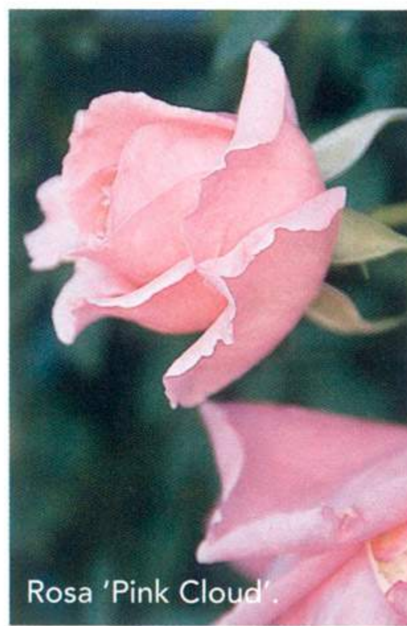
Rosa 'Pink Cloud'.