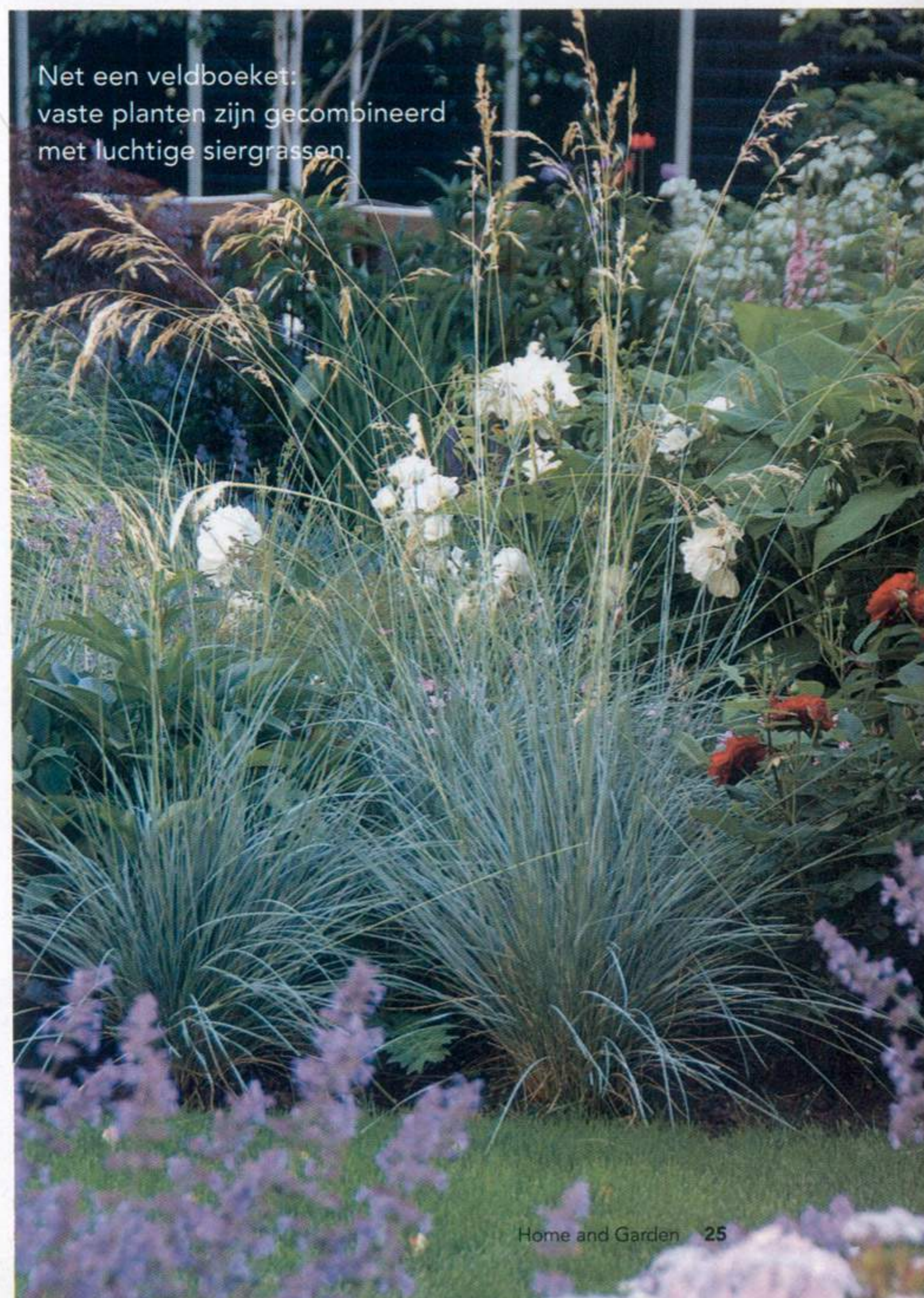
Net een veldboeket: vaste planten zijn gecombineerd met luchtige siergrassen.