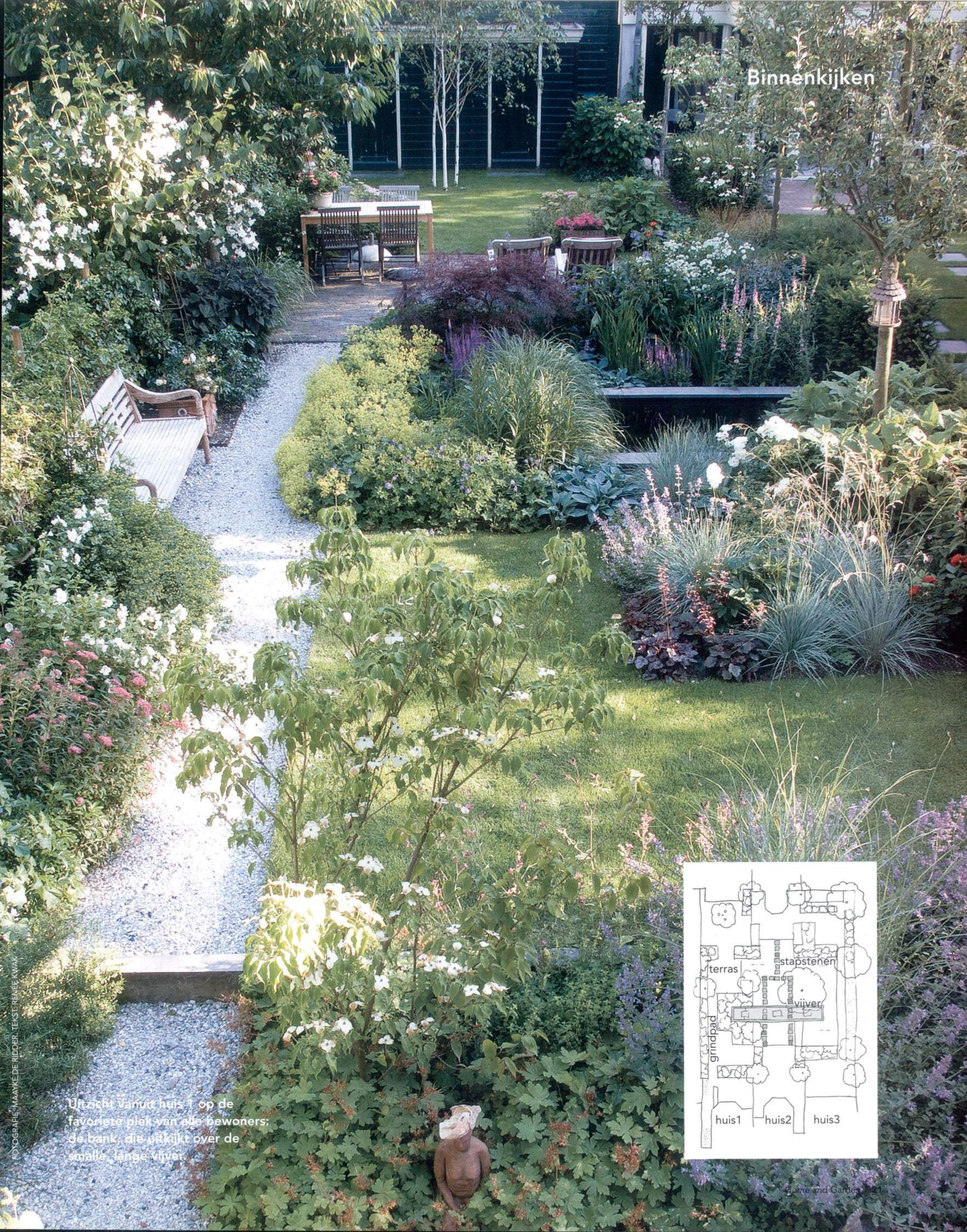
Uitzicht vanuit huis 1 op de favoriete plek van alle bewoners: de bank, die uitkijkt over de smalle, lange vijver.