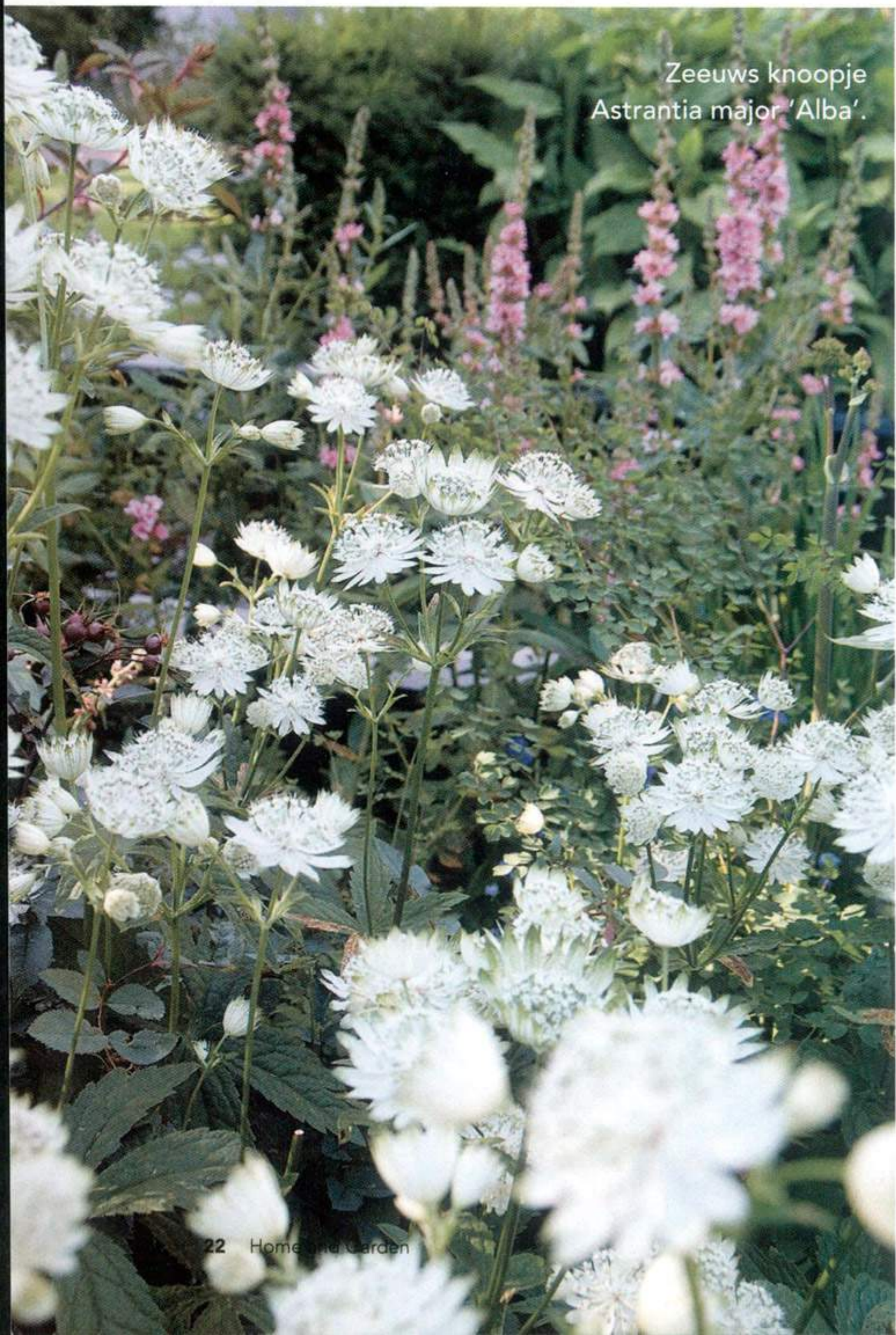
Zeeuws knoopje Astrantia major 'Alba'.